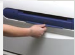
②シャッターを開けます