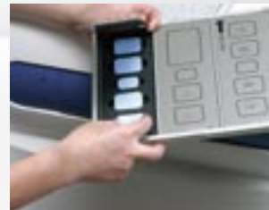
①撮影したデンタルIPは専用の カセットにセットします

ワイシーアール21 エックスジーはカセット投入型です。 右および下写真①～⑥は口内法カセットの出し入れ手順 ですが、パノラマとセファロについてはカセットのフタ を開ける必要はありません。排出されたカセットはすぐに 次の撮影ができます。