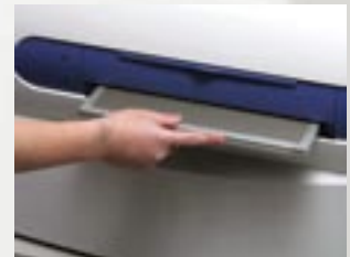
⑥残像を消去したIPがカセットに 入ったまま出てきます