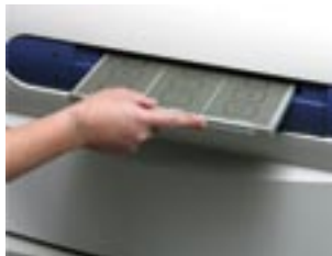
③カセットを挿入します