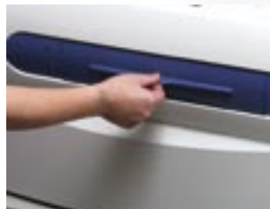
④シャッターを閉じます