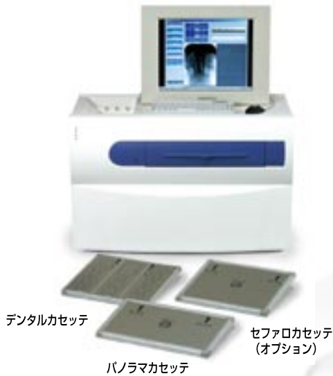
デンタルカセット

開発の重点項目の一つが“アナログ感覚で診断できる画像”でした。 これは言うまでもなく、生画像の質を上げることです。 言い換えれば、イメージングプレートから得られる画像を忠実に再現する技術です。