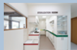
やまもと歯科医院のステリライゼーションルーム