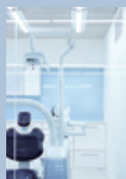
Shurenkai Dental Prosthodontics Institute のトリートメントルーム