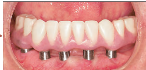
ティッシュインテグレートッド補綴物。