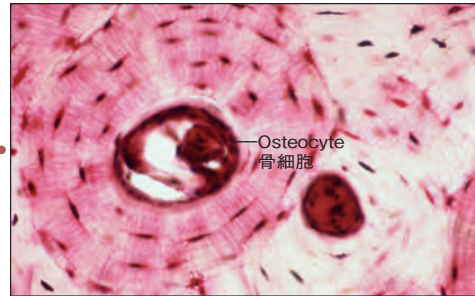
骨細胞 (塩基性フクシンで染色した非脱灰切片; 拡大×250)。