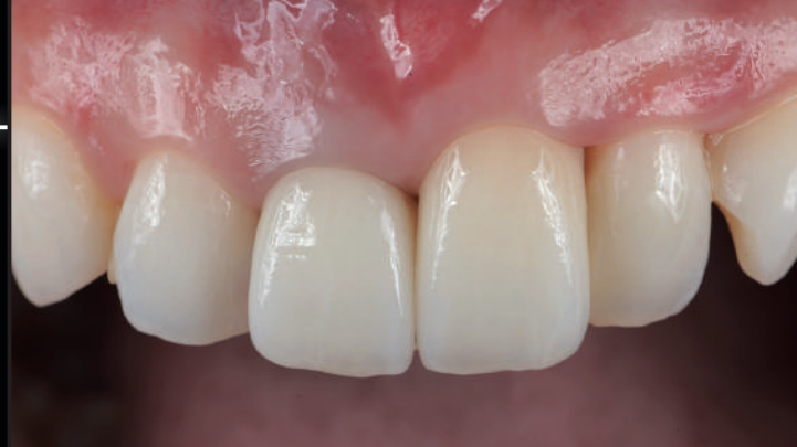
IPS e.max Press および IPS e.max Ceram の分光反射率の膨大な測定結果を一挙に大公開。e.max ユーザーは必見。