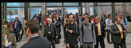
2015年3月にドイツのケルンで開催された世界最大のデンタルショーIDSを徹底レポート。最新の動向を見逃すな！