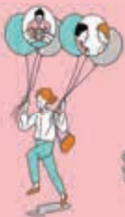
[表紙イラスト] フジノマ