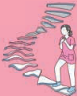
[表紙イラスト] 芦野公平

バキュームの難しい部位の ポジションや使用する際の テクニックを教えてください。