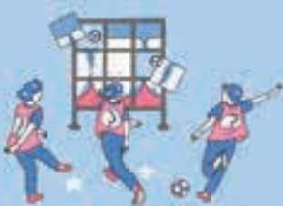
【表紙イラスト】 芦野公平