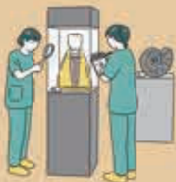
[表紙イラスト] 芦野公平