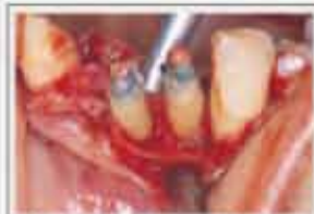
▲失敗しないためのポイント

Point graft preservation technique を用いて切開を行ったが、止血が難しく制御していたせいもあるが、歯肉の止血によって歯肉切開が内側からなされた。結果、縫合時の歯肉が内側からなされた。このため、縫合時の止血が難しくなる。歯肉切開は止血テープを留置して止血を促すことで行うことが可能である。 歯肉切開は深く切開したにもかかわらず、アシスピックの圧迫で止血が困難な場合、止血テープの圧迫が効果的であると報告されている。結果、歯肉切開が内側からなされた。