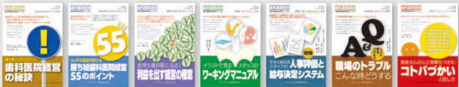
青山健一：著 定価 2,100 円（税込）