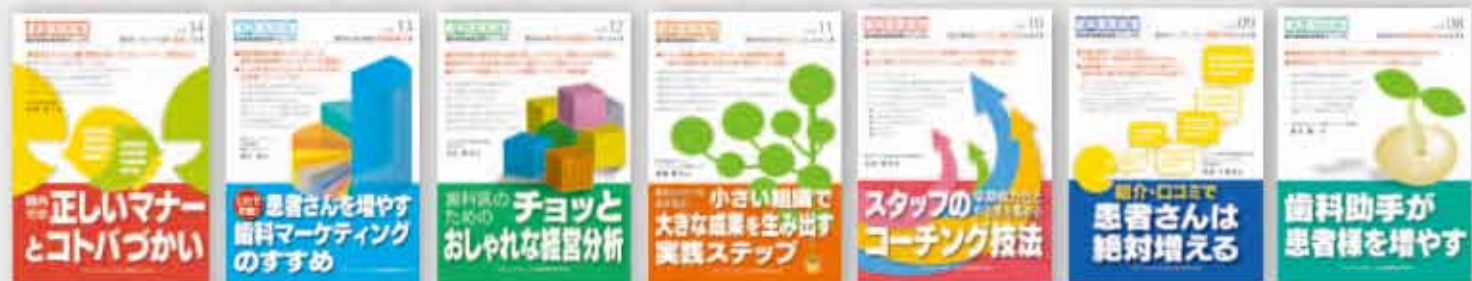
山岸弘子：著 定価 2,100 円（税込）