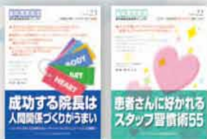
田中保次：著 定価 2,100 円（税込）