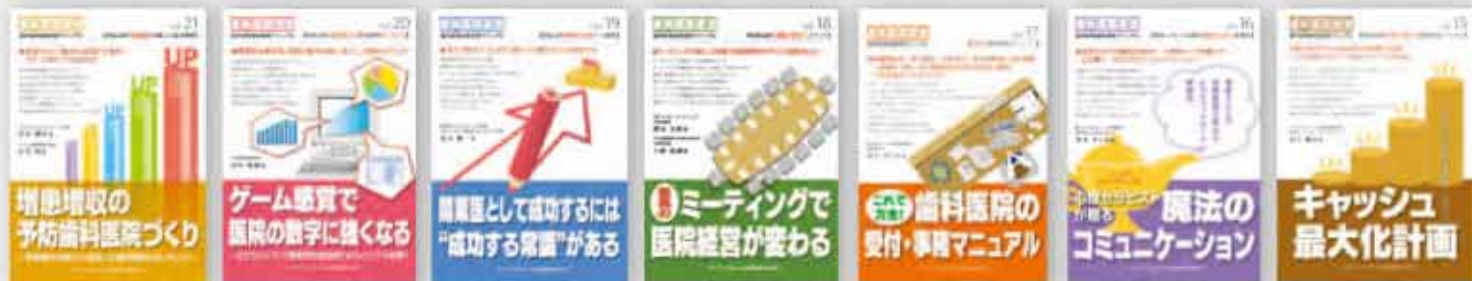
岩田健男、石川 明：著 定価 2,100 円（税込）