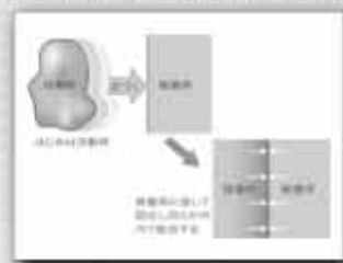
接着が生じる原理