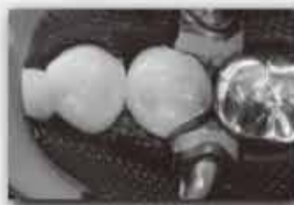
マトリックスの装着